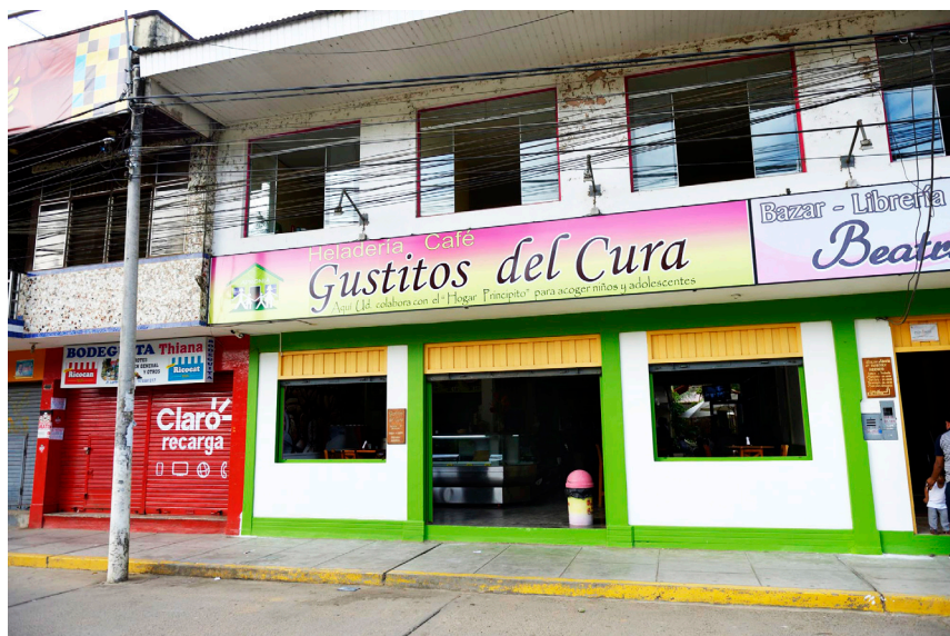
Los Gustitos en la Plaza de Armasal centro de Puerto Maldonado

Apronia da albergue a los niños. Al mismo tiempo la asociación es un empleador e importante actor económico local.