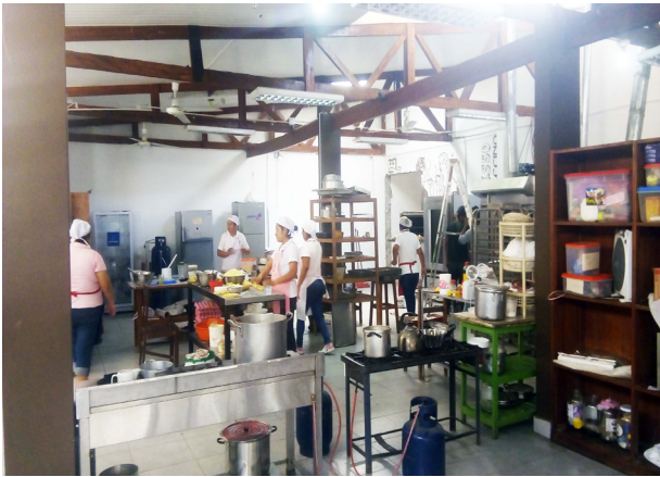
Las nuevas instalaciones de producción (provisorias) en la galería contigua alquilada, al fondo a la derecha, la puerta abierta en la pared medianera.

Gracias al alquiler de las arcadas vecinas, la producción, mudada, continúa en los laboratorios temporales durante el trabajo de restauración.