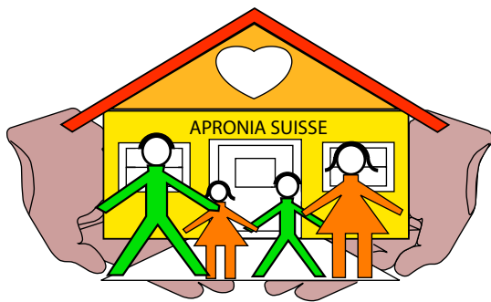
Association partenaire de l'asociación de protección del niño y adolescente "Apronia" Puerto Maldonado - Perú