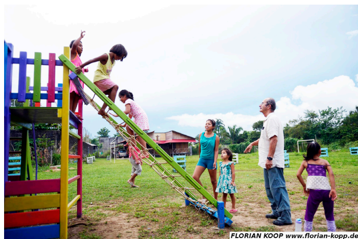
FLORIAN KOOP www.florian-kopp.de