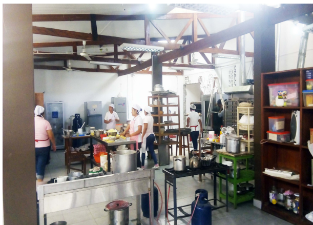
Les nouveaux locaux de production (provisoires) dans l'arcade voisine louée, à droite au fond la porte ouverte dans la paroi mitoyenne

Grâce à la location des arcades voisines, la production, déménagée, se poursuit dans des laboratoires provisoires pendant les travaux de réfection.