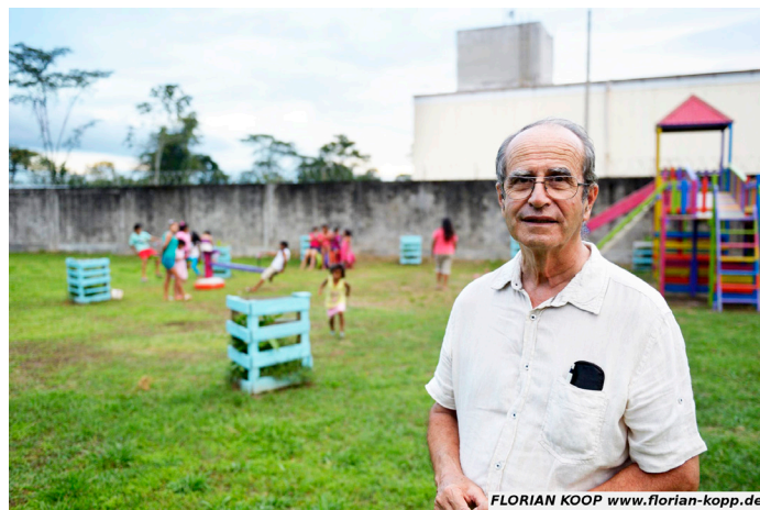
FLORIAN KOOP www.florian-kopp.de