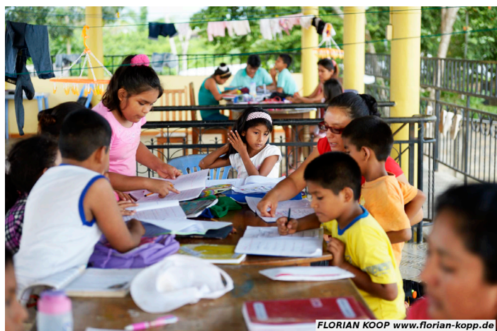
FLORIAN KOOP www.florian-kopp.de