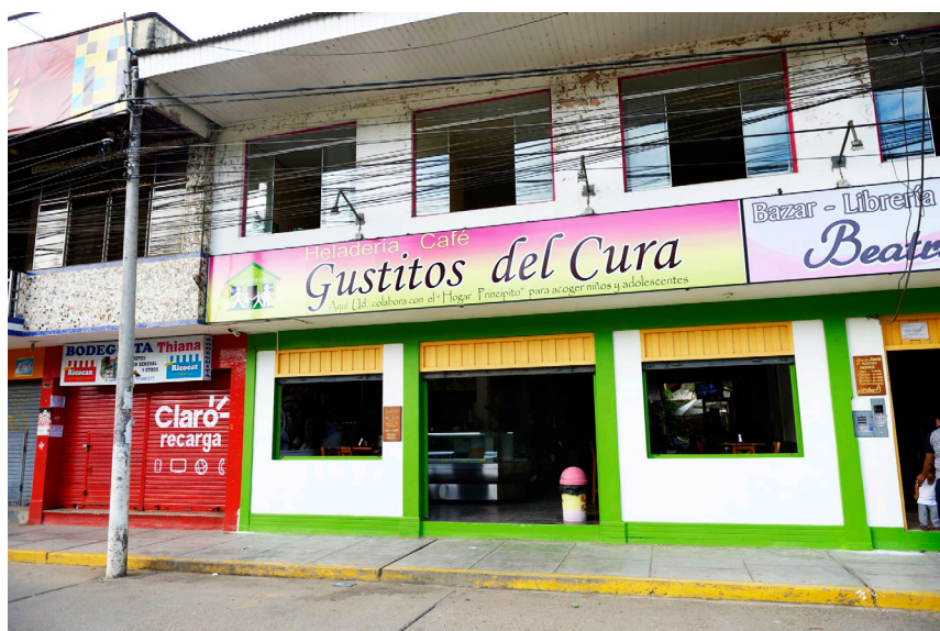
Les Gustitos sur la Plaza de Armas au centre de Puerto Maldonado (à gauche les arcades qu'il a été possible de louer pendant les travaux de réfection)

Apronia accueille les enfants. En même temps, l'association est un employeur et acteur économique local important